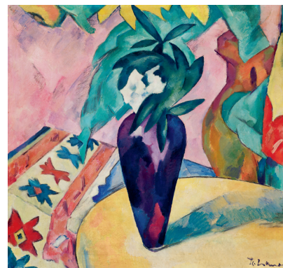
Cover: Ernst Ludwig Kirchner, Schlangemensch, Öl auf Leinwand, 1921 (Detail), Foto: punctum/Bertram Kober Oben: Karl Hofer, Zwei Mädchen liegend, Öl auf Leinwand, 1924/26 © VG Bild-Kunst, Bonn 2023, Foto: punctum/Bertram Kober Links außen: Adolf Hölzel, Komposition »Anbetung«, Pastell auf Papier, um 1925, Foto: punctum/Bertram Kober Unten links: Otto Mueller, Sitzende im Schilf (Mädchenakt), Schwarze Leimfarbe auf Leinwand, um 1925, Foto: Lindenau-Museum Altenburg Unten Mitte: Heinrich Nauen, Blumenvase auf rundem Tisch, Öl auf Leinwand, um 1919, Foto: punctum/Bertram Kober Unten rechts: Ernst Ludwig Kirchner, Stillleben mit Gemüsetopf, Rückseite von »Schlangemensch« (1921), Öl auf Leinwand, um 1910, Foto: punctum/Bertram Kober